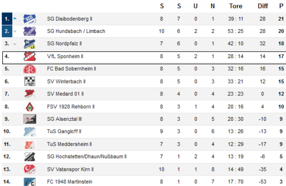
Tabelle entnommen von: www.fupa.net